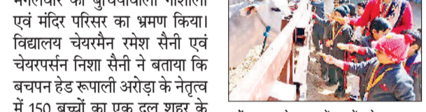
महेन्द्रगढ़। गोशाला में गायों को गुड खिलाते विद्यार्थी।