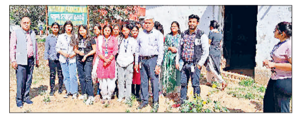
महेन्द्रगढ़। कृषि विज्ञान केंद्र का भ्रमण करती छात्राएं।