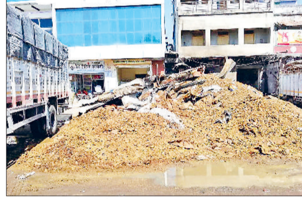
नारनौल। आग लगने के बाद गोदाम का दृश्य।

29 फरवरी की रात अनाज मंडी में बिनौला खल गोदाम में लगी थी आग, घटना के समय गोदाम में सो रहे पांच मजदूरों में से दो की मौके पर ही गई थी मौत, झुलसे 3 में से एक और ने तोड़ा दम