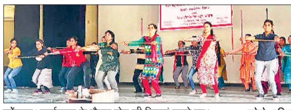
महेन्द्रगढ़। कार्यशाला के दौरान योग की क्रियाएं करते हुए।